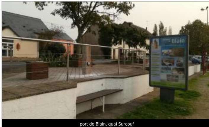
port de Blain, quai Surcouf