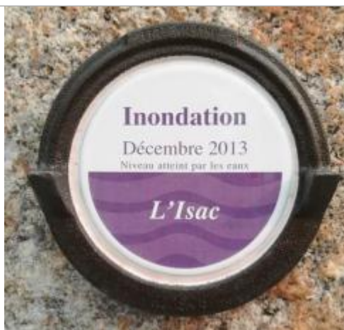
Repère normalisé de décembre 2013

Altitude calculée de l'eau (en m) : 14.95 m