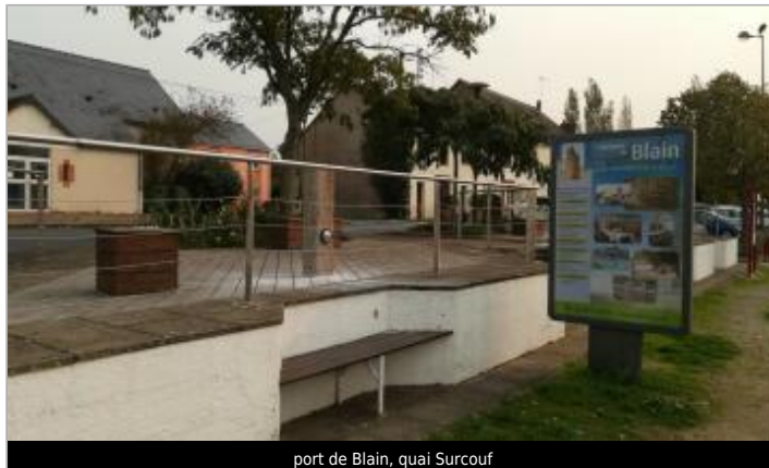
port de Blain, quai Surcouf

Coordonnées WGS84 : X: -1.76554323 / Y: 47.46971230