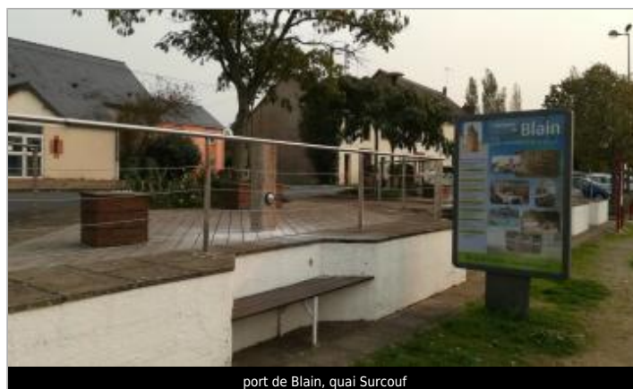
port de Blain, quai Surcouf

GÉOLOCALISATION Coordonnées WGS84 : X: -1.76554323 / Y: 47.46971230 Coordonnées RGF93 (Lambert 93) : X: 341249.82 / Y: 6718534.92 Coordonnées RGF93 (ETRS89) : X: -1.7655432 / Y: 47.4697123 Code Hydro: J9--0250 Rive de référence: Droite