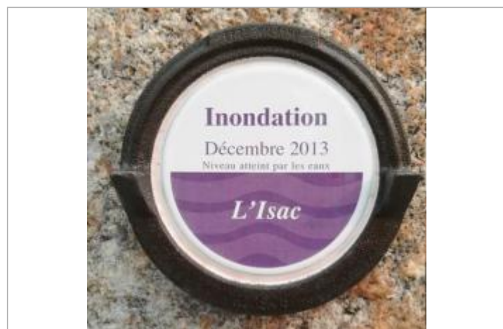
Repère normalisé de décembre 2013

GÉNÉRAL Code : SPC_44415_01_2013 Date de mise à jour : 07/08/2025 Auteur : SPC VCB