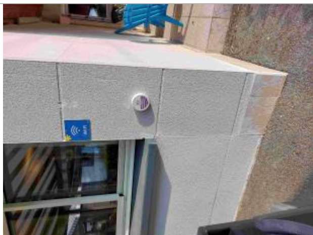
Crue du Gouëdic le 03/10/2020 entre Saint-Brieuc et Ploufragan

Organisme(s) : Saint-Brieuc Armor Agglomération