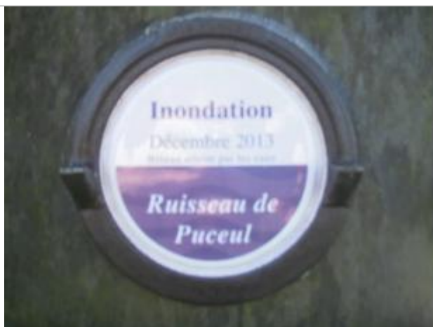
Repère normalisé de décembre 2013

Altitude calculée de l'eau (en m) : 26.43 m