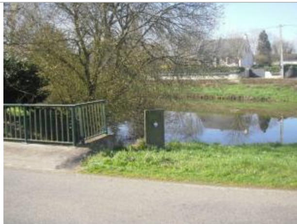
poteau sur le coté du pont de la RD39