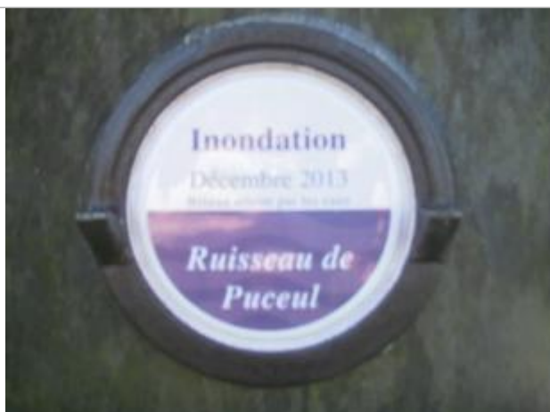
Repère normalisé de décembre 2013

Altitude calculée de l'eau (en m) : 26.43