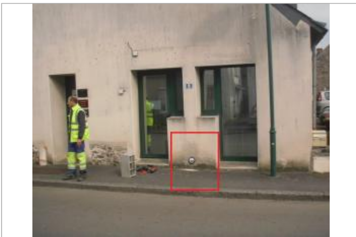
bâtiment au 8 rue de la résistance à Saffré

GÉOLOCALISATION Coordonnées WGS84 : X: -1.57800124 / Y: 47.50146690 Coordonnées RGF93 (Lambert 93) X: 355556.24 / Y: 6721221.32 Coordonnées RGF93 (ETRS89) : X: -1.5780012 / Y: 47.5014669 Code Hydro: Rive de référence: Droite