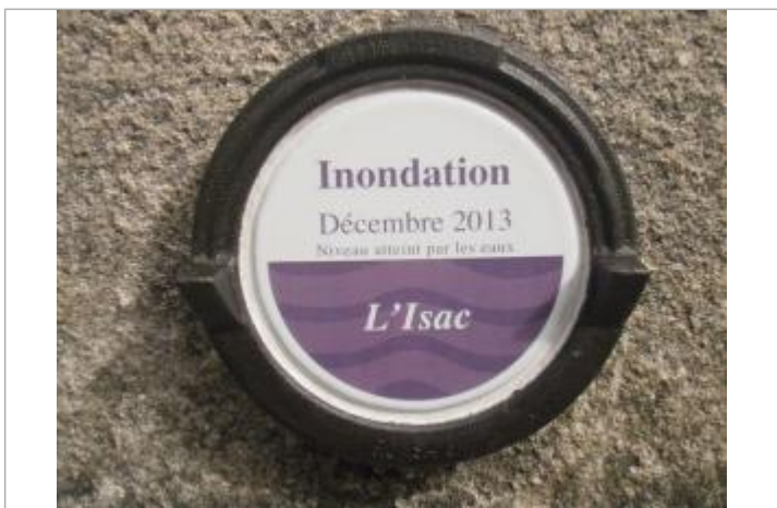
Repère normalisé de décembre 2013

GÉNÉRAL Code : SPC_44419_03_2013 Date de mise à jour : 21/10/2025 Auteur : SPC VCB