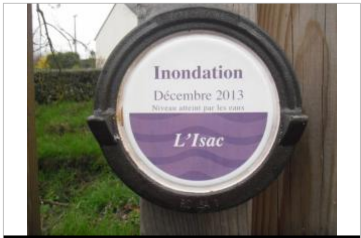
Repère normalisé de Décembre 2013

GÉNÉRAL Code : SPC_44419_01_2013 Date de mise à jour : 07/08/2025 Auteur : SPC VCB