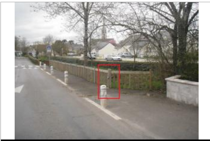
Poteau rive gauche rue de l'Isac à Saffré

GÉOLOCALISATION Coordonnées WGS84 : X: -1.57588742 / Y: 47.50179100 Coordonnées RGF93 (Lambert 93) X: 355717.19 / Y: 6721248.05 Coordonnées RGF93 (ETRS89) : X: -1.5758874 / Y: 47.501791 Code Hydro: Rive de référence: Gauche