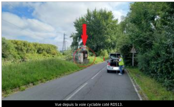
Vue depuis la voie cyclable coté RD513.