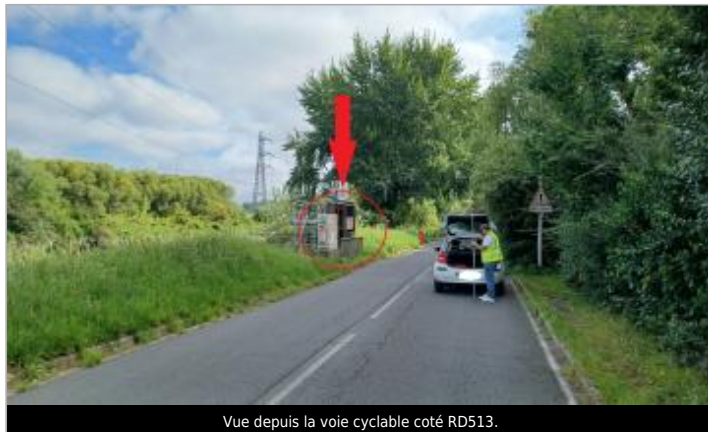
Vue depuis la voie cyclable coté RD513.

Coordonnées WGS84 : X: -0.31834934 / Y: 49.18385590