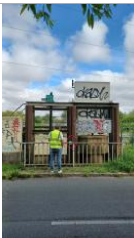
Macaron sur ouvrage