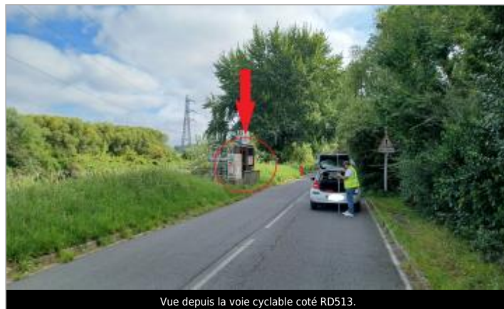
Vue depuis la voie cyclable coté RD513.

GÉOLOCALISATION Coordonnées WGS84 : X: -0.31834934 / Y: 49.18385590 Coordonnées RGF93 (Lambert 93) X: 458120.97 / Y: 6903318.24 Coordonnées RGF93 (ETRS89) : X: -0.3183493 / Y: 49.1838559 Code Hydro: I2--0200 Rive de référence: Droite