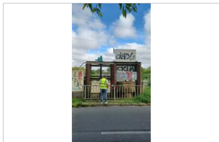
Macaron sur ouvrage

GÉNÉRAL Code : WEB_R_202508052040 Date de mise à jour : 06/08/2025 Auteur : SPC.SACN