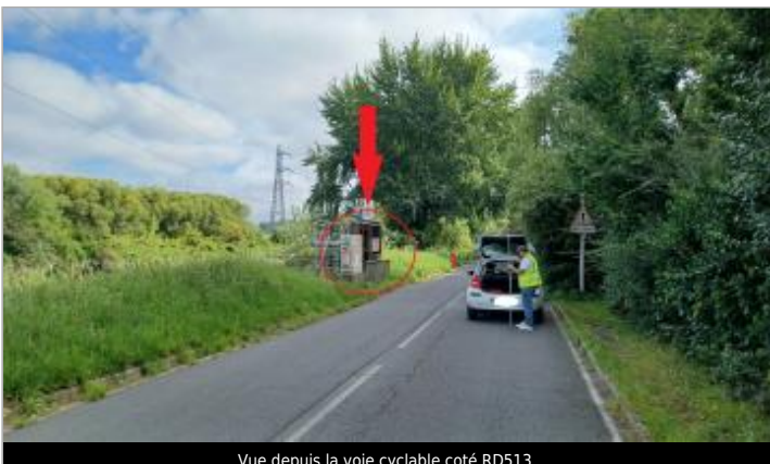
Vue depuis la voie cyclable coté RD513.

GÉOLOCALISATION Coordonnées WGS84 : X: -0.31834934 / Y: 49.18385590 Coordonnées RGF93 (Lambert 93) X: 458120.97 / Y: 6903318.24 Coordonnées RGF93 (ETRS89) : X: -0.3183493 / Y: 49.1838559 Code Hydro: I2--0200 Rive de référence: Droite