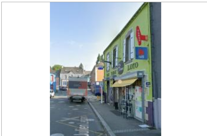
Bar-tabac Le Blavet sur l'île de Locastel