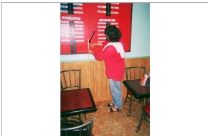
Interieur du bar-tabac Le Blavet au niveau du panneau des résultats

Maximum de l'inondation : Oui Visibilité : Non État du repère : Disparu Pérennité : Aucune Repère calculé : Non PHEC : Non