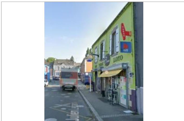
Bar-tabac Le Blavet sur l'île de Locastel