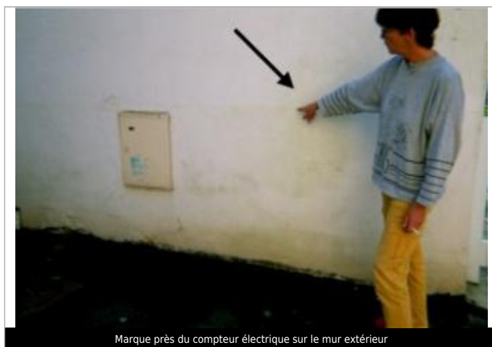
Marque près du compteur électrique sur le mur extérieur

Différence entre le niveau d'eau et la référence (en m) : 0.970 m