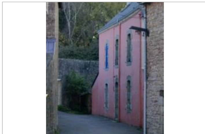
Maison au 13 quartier Julien Legrand