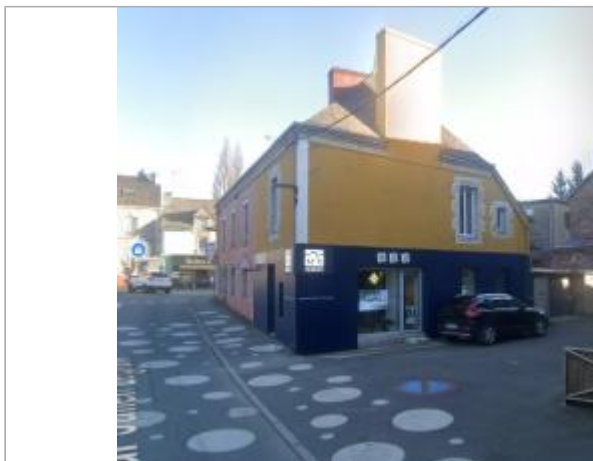
Agence immobilière (ancienne agence bancaire) au 11 quartier Julien Legrand en 2025