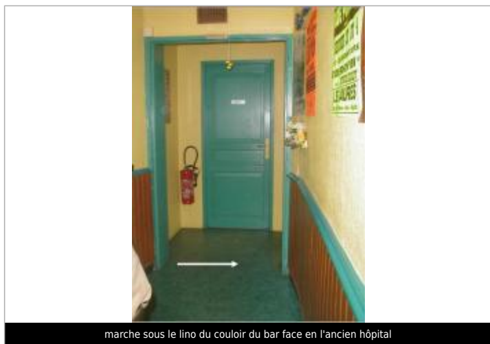
marche sous le lino du couloir du bar face en l'ancien hôpital

Système altimétrique : NGF IGN 1969 (système normal)