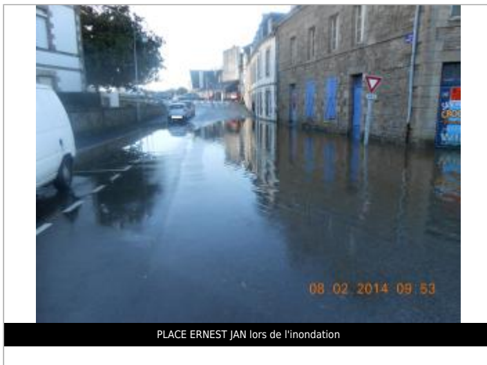
PLACE ERNEST JAN lors de l'inondation