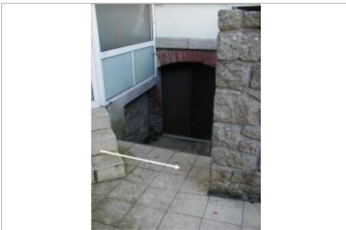
A l'arrière du bâtiment au n°1 quai du couvent

GÉOLOCALISATION Coordonnées WGS84 : X: -2.96606948 / Y: 48.07000780 Coordonnées RGF93 (Lambert 93) X: 256063.45 / Y: 6791182.25 Coordonnées RGF93 (ETRS89) : X: -2.9660695 / Y: 48.0700078 Code Hydro: J5--0210 Rive de référence: Gauche