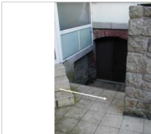
A l'arrière du bâtiment au n°1 quai du couvent

Coordonnées WGS84 : X: -2.96606948 / Y: 48.07000780