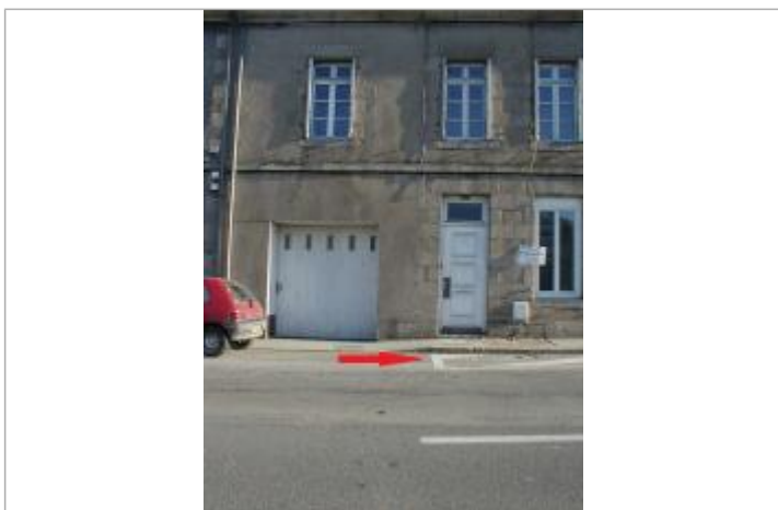
Rigole d'eaux pluviales se situant entre la route et le trottoir

Code : BP15_PONTIVY_2001 Date de mise à jour : 28/07/2025