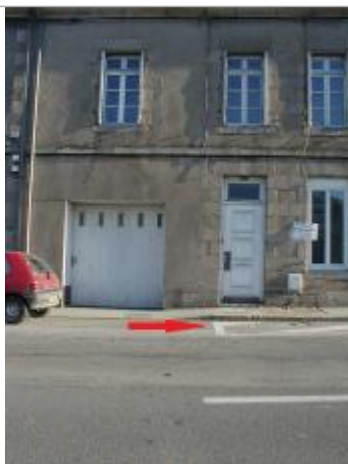
Rigole d'eaux pluviales se situant entre la route et le trottoir

Description référence du repère : limite de l'inondation au niveau de la rigole d'eaux pluviales se situant entre la route et le trottoir.