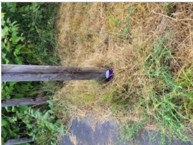
crue de l'Arve de novembre 2023 chemin des bois noirs

Texte : crue de l'Arve du 14 novembre 2023