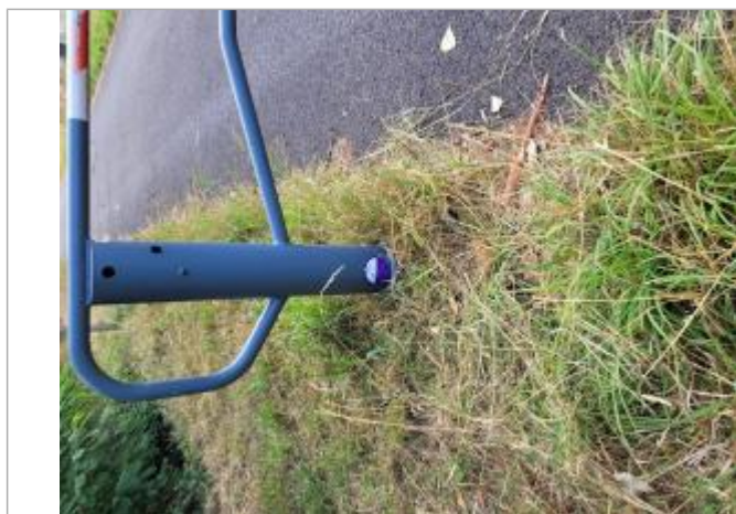
crue de l'Arve de novembre 2023 entrée voie verte