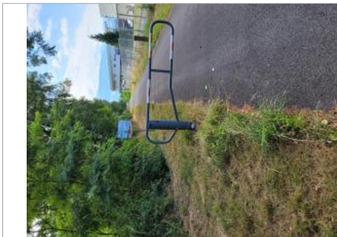
Entrée voie verte Léman-Mont Blanc

Coordonnées WGS84 : X: 6.63248613 / Y: 45.96232320