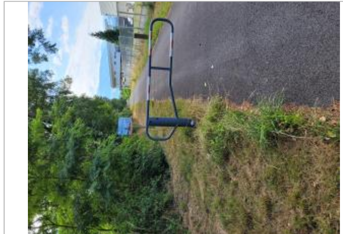
Entrée voie verte Léman-Mont Blanc

Coordonnées WGS84 : X: 6.63248613 / Y: 45.96232320