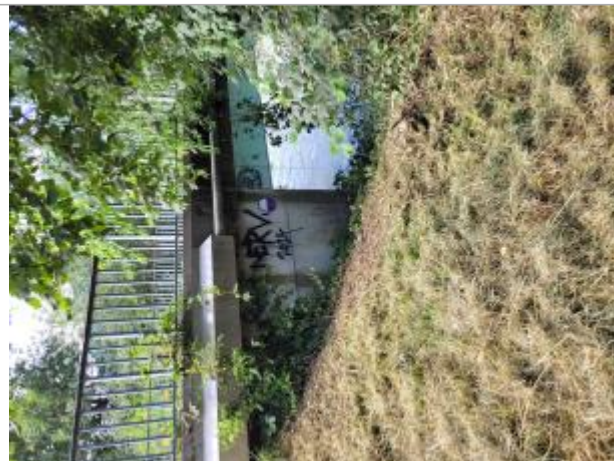
pont de Luzier

Coordonnées WGS84 : X: 6.63094831 / Y: 45.96775900