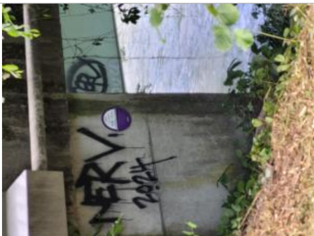
crue de l'Arve de novembre 2023 pont de Luzier