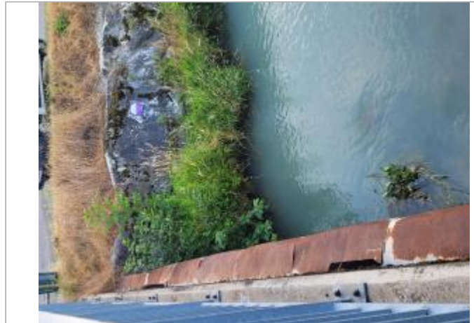
La Bialle pont des régies