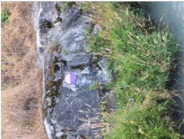
crue de l'Arve de novembre 2023 pont des régies