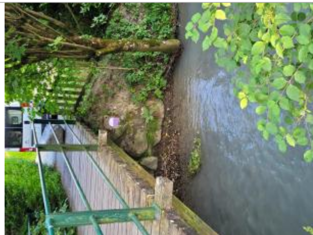
La Bialle impasse du battoir

Coordonnées WGS84 : X: 6.64165493 / Y: 45.93078160