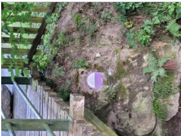
crue de l'Arve de novembre 2023 impasse du battoir