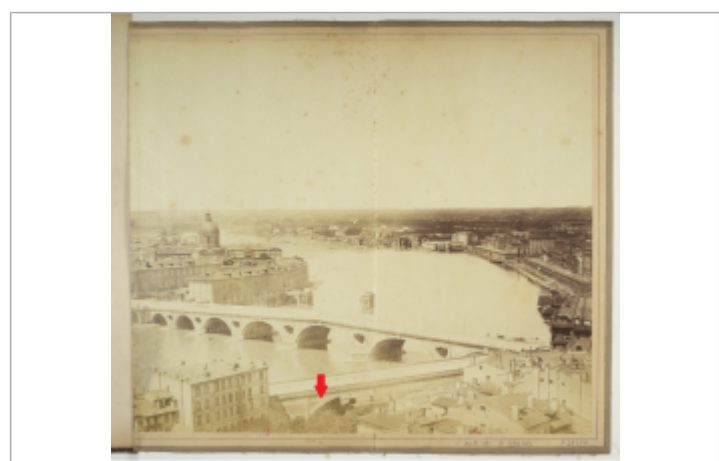
Photo d'époque à partir de laquelle la levée de la laisse de crue de 1875 a été réalisée

NIVELLEMENT D'UNE LAISSE DE CRUE SOUS LE TIRANT D'AIR D'UN OUVRAGE D'ART - 29/04/1875 Méthode : Méthode combinée Organisme : SPC Garonne - Tarn - Lot Commentaires sur le nivellement : - Altitude de la référence levée par méthode GNSS - Différence entre le niveau d'eau et la référence levée par échelle Référence nivelée : Marque d'inondation Système altimétrique : NGF IGN 1969 (système normal) Altitude de la référence (en m) : 136.031 m Différence entre le niveau d'eau et la référence (en m) : 4.050 m Altitude calculée de l'eau (en m) : 140.081 m