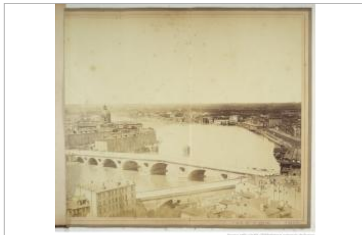
Photo du site à partir de laquelle 3 mesures de laisse de la crue de 1875 ont été réalisées par le SPC GTL

GÉOLOCALISATION Coordonnées WGS84 : X: 1.44060290 / Y: 43.59861010 Coordonnées RGF93 (Lambert 93) : X: 574054 / Y: 6278972 Coordonnées RGF93 (ETRS89) : X: 1.4406029 / Y: 43.5986101 Code Hydro: O---0000 Rive de référence: Droite