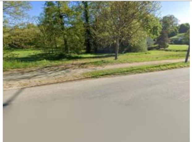
Chemin d'accès propriété au bord de la RD 528