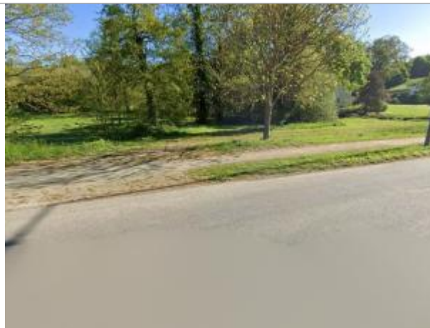
Chemin d'accès propriété au bord de la RD 528