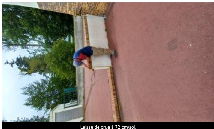
Laisse de crue à 72 cm/sol.

SOURCE DE REPÉRAGE : VISITE DE TERRAIN SPC SACN - 11/03/2020