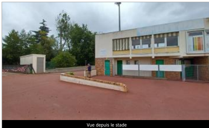
Vue depuis le stade