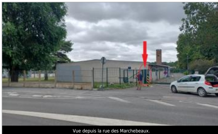
Vue depuis la rue des Marchebeaux.