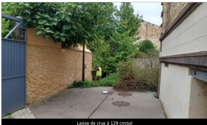
Laisse de crue à 129 cm/sol

SOURCE DE REPÉRAGE : VISITE DE TERRAIN SPC SACN - 11/03/2020