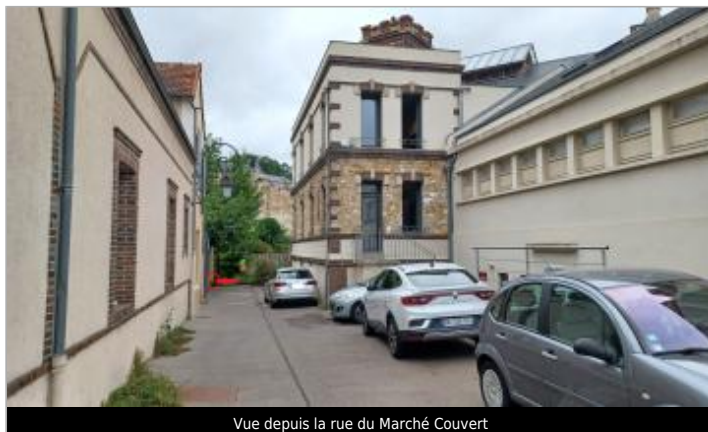
Vue depuis la rue du Marché Couvert