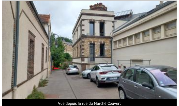
Vue depuis la rue du Marché Couvert

Coordonnées WGS84 : X: 1.36385756 / Y: 48.73563300