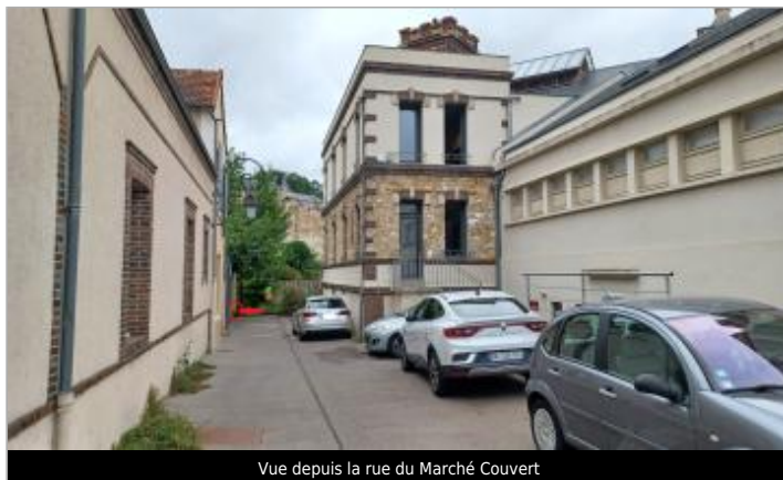
Vue depuis la rue du Marché Couvert