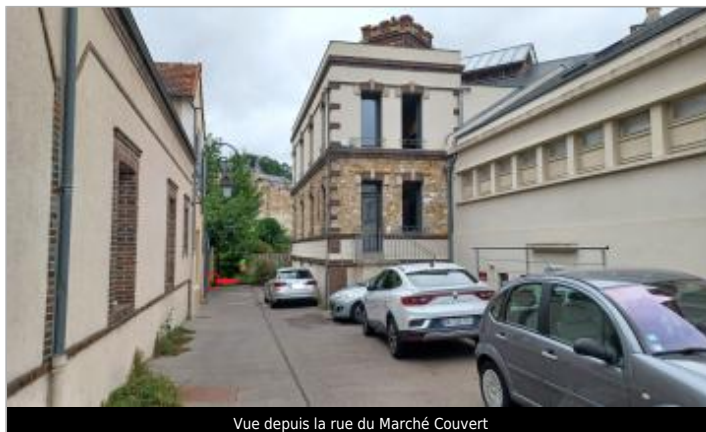
Vue depuis la rue du Marché Couvert