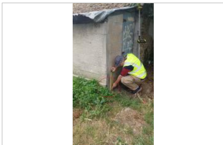
Laisse de crue à 4 cm/sol.

SOURCE DE REPÉRAGE : VISITE DE TERRAIN SPC SACN - 11/03/2020