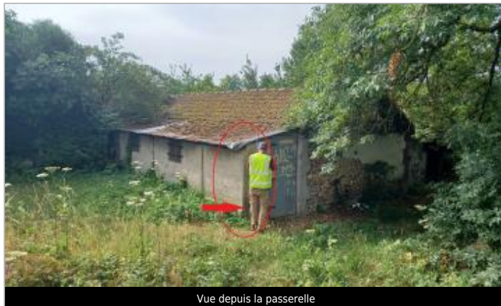
Vue depuis la passerelle