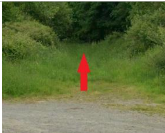
chemin d'exploitation agricole