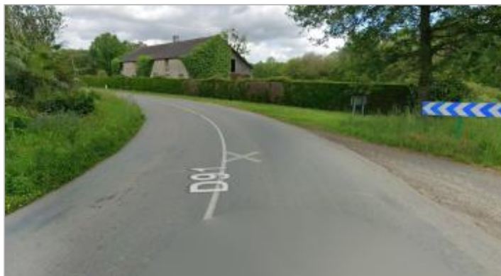
Chaussée de la RD91, dans le virage de la rue de la gare