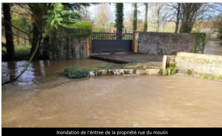
Inondation de l'entrée de la propriété rue du moulin