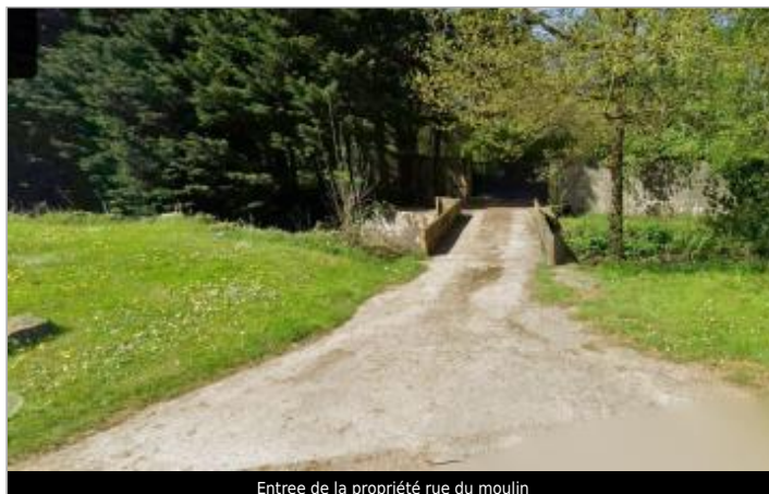
Entree de la propriété rue du moulin