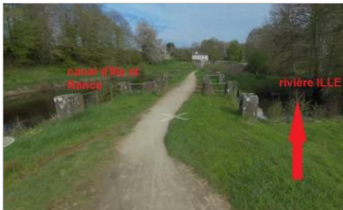
Rivière Ille juste avant la confluence avec le canal d'Ille et Rance