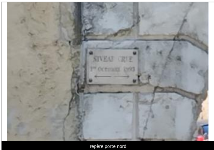
repère porte nord

Texte : Niveau crue 1er octobre 1993 Visibilité : Oui État du repère : Bon Pérennité : Longue