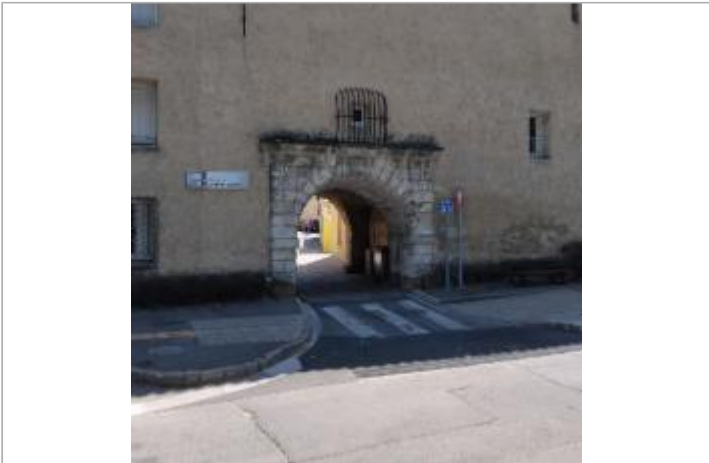
Ancienne porte Nord - cours de la république