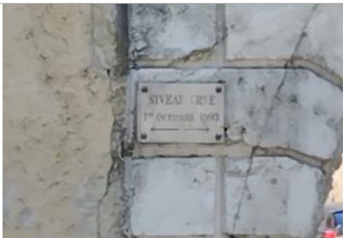
repère porte nord