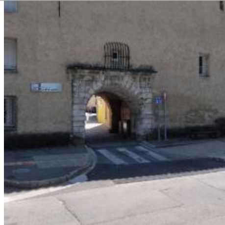
Ancienne porte Nord - cours de la république