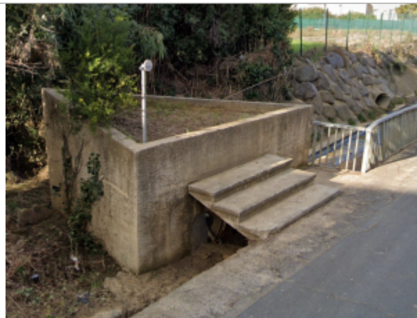
av puissalicon lieuran

Coordonnées WGS84 : X: 3.23744233 / Y: 43.42030930