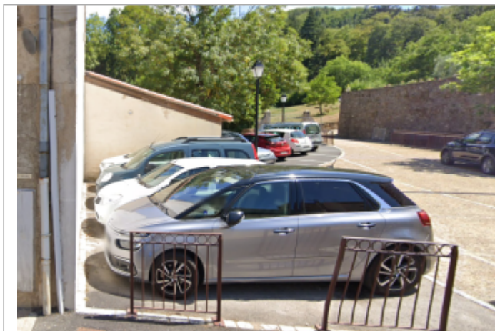
parking av des treilles