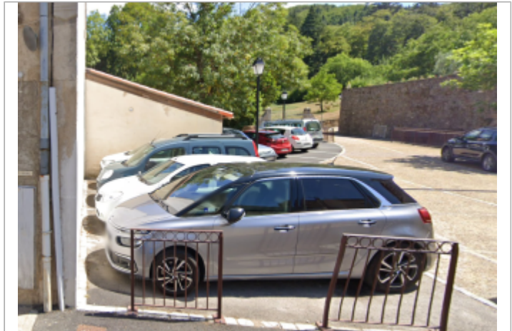
parking av des treilles