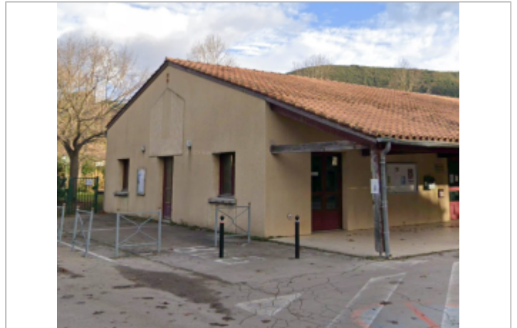
salle polyvalente villemagne

Coordonnées WGS84 : X: 3.11974278 / Y: 43.61869960