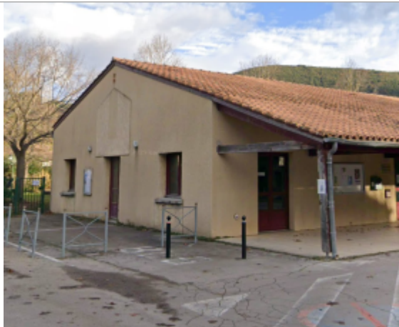
salle polyvalente villemagne