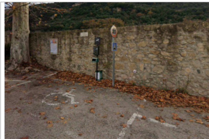
porte barbacane villemagne argentiere

Coordonnées WGS84 : X: 3.11994869 / Y: 43.61628980