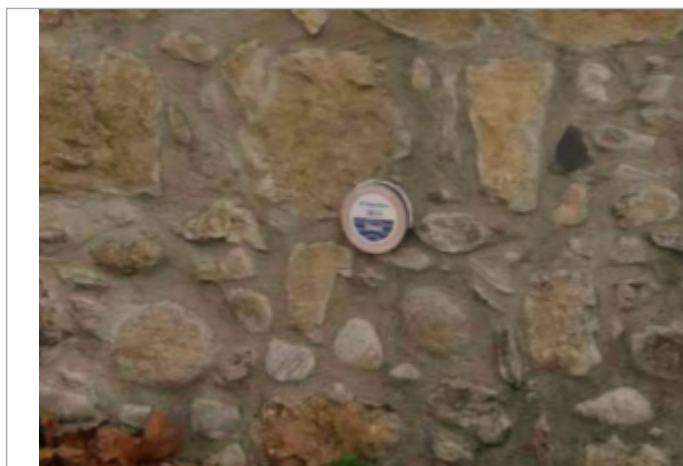
porte barbacane villemagne argentiere