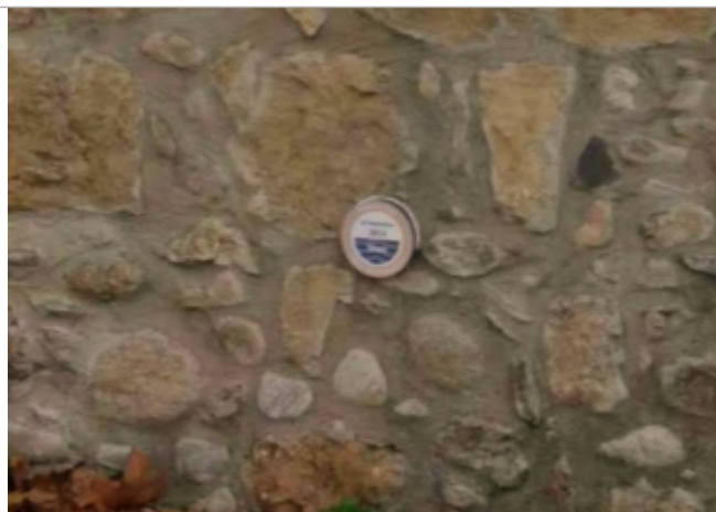
porte barbacane villemagne argentiere

Altitude calculée de l'eau (en m) : 193.34 m