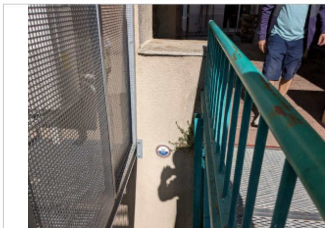
repere passerelle piétonne