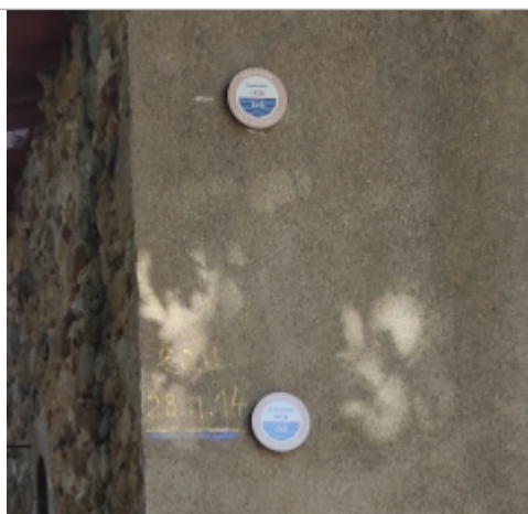
entree hameau taillevent

Altitude calculée de l'eau (en m) : 258.48 m