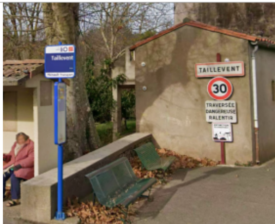
entree hameau taillevent

Coordonnées WGS84 : X: 3.16816377 / Y: 43.70820960