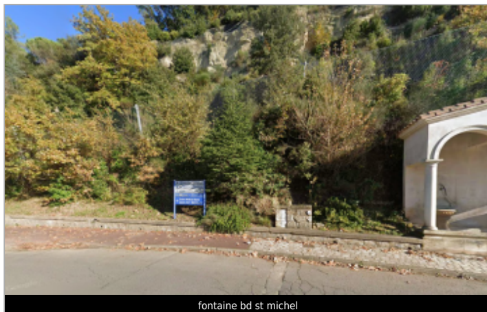
fontaine bd st michel

Coordonnées WGS84 : X: 3.08467626 / Y: 43.59578170