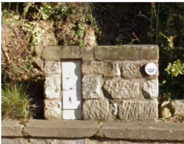
fontaine bd st michel

Altitude calculée de l'eau (en m) : 181.17 m