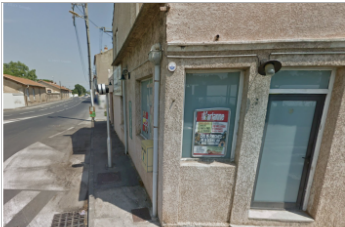
bar el dorado