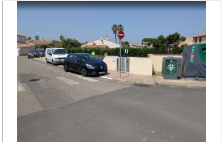
rue du ponant