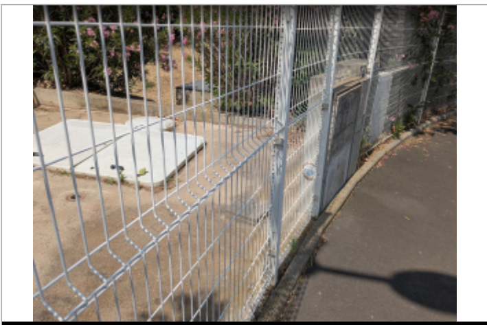
site rue paul riquet

GÉOLOCALISATION Coordonnées WGS84 : X: 3.28462339 / Y: 43.32107570 Coordonnées RGF93 (Lambert 93) X: 723100.48 / Y: 6246921.62 Coordonnées RGF93 (ETRS89) : X: 3.2846234 / Y: 43.3210757