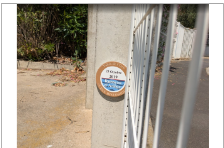
repere station pompage rue paul riquet

MARQUE Maximum de l'inondation : Oui Visibilité : Oui État du repère : Bon Pérennité : Longue