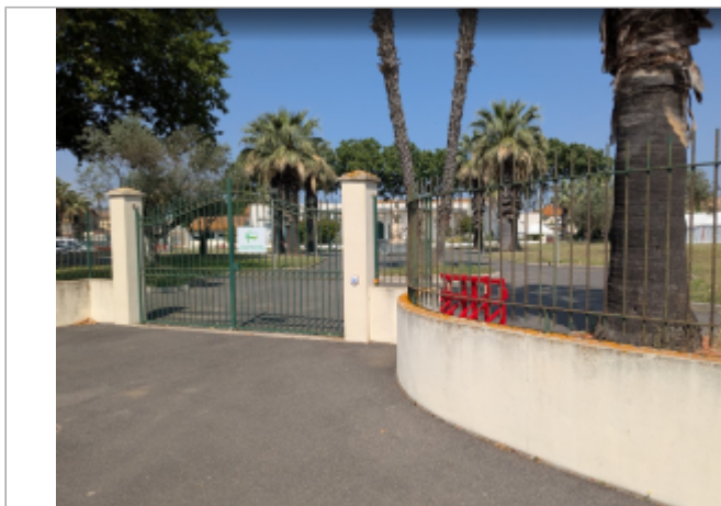
entree parc liberté

Coordonnées RGF93 (ETRS89) : X: 3.2838416 / Y: 43.3133512