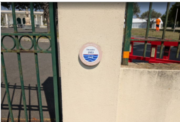
entree parc liberté