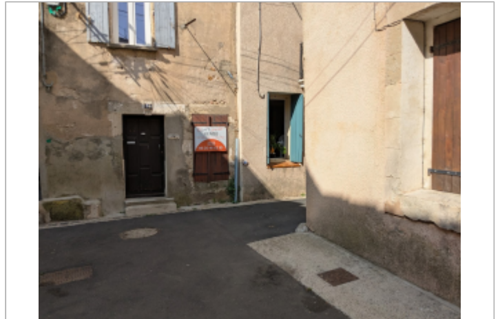
24 rue michelet serignan