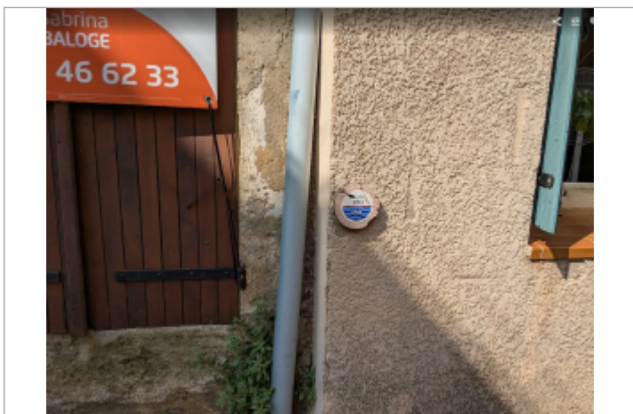
24 rue michelet serignan

Maximum de l'inondation : Oui Visibilité : Oui État du repère : Mauvais Pérennité : Moyenne